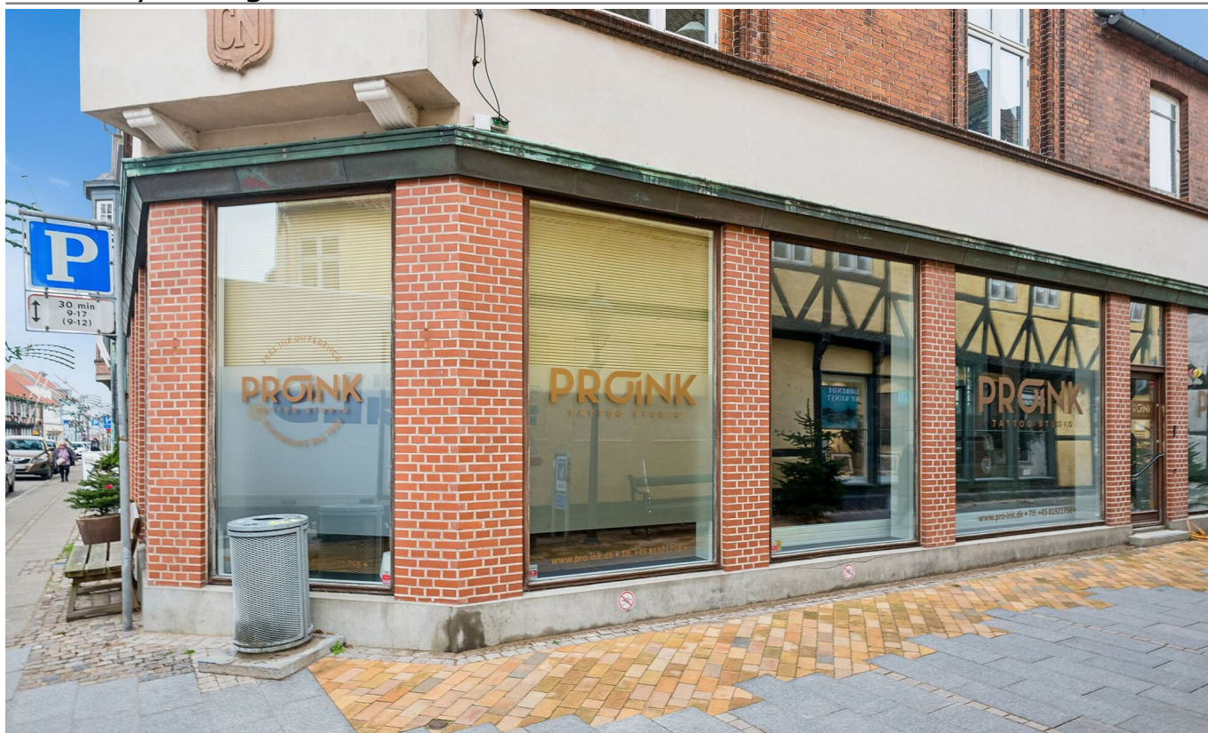
Hjørnelokaler i Nykøbing F