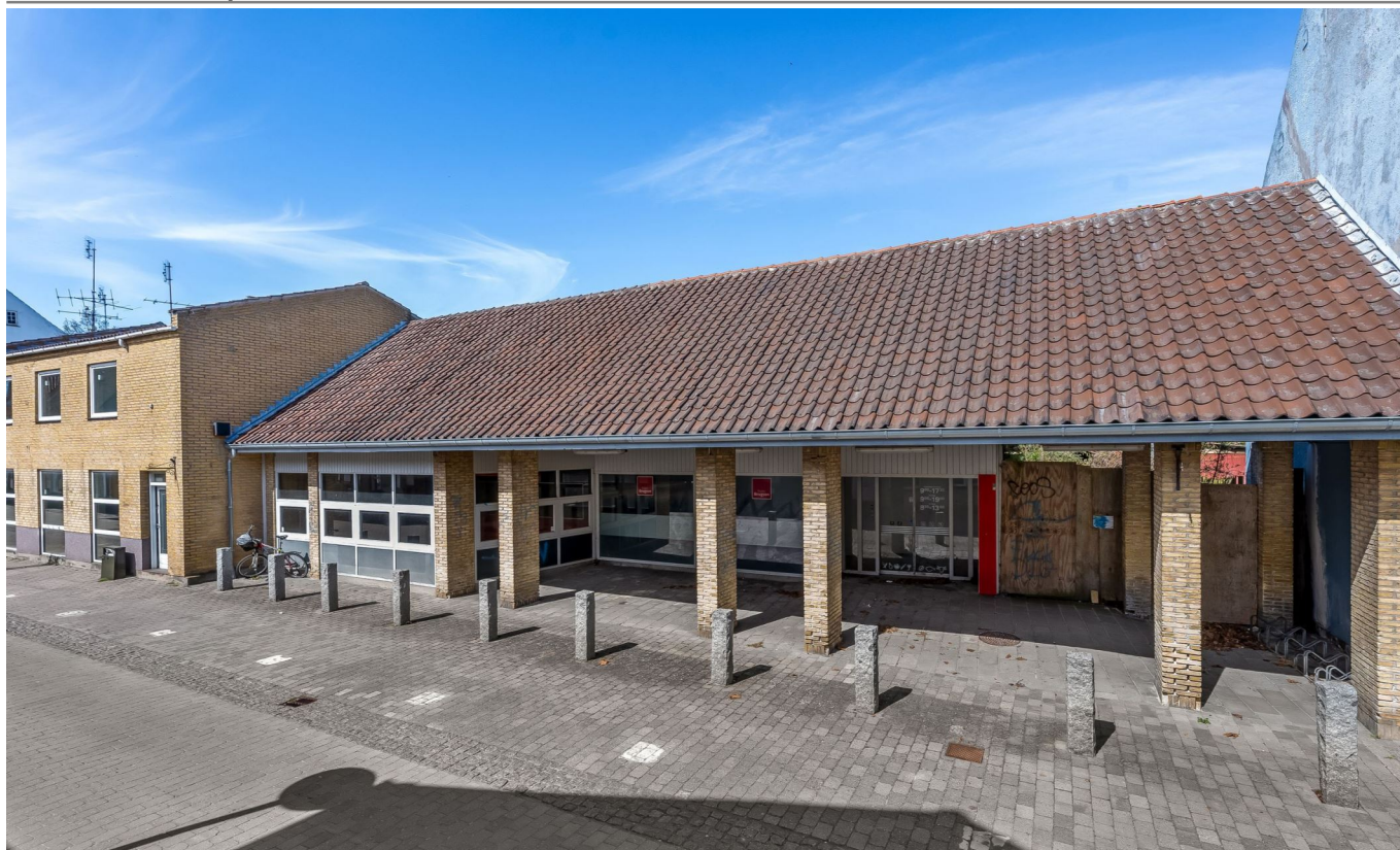
Centralt Beliggende Ejendom med Stort Potentiale